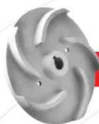
پروانه مدل: S-A